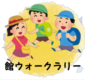
館ウォークラリー