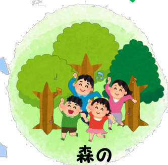
森の ガイドツアー